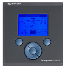
Tableau de contrôle Blue Power

Un solution pratique et bon marché pour une surveillance à distance, avec un bouton rotatif pour configurer les niveaux de Power Control et Power Assist.